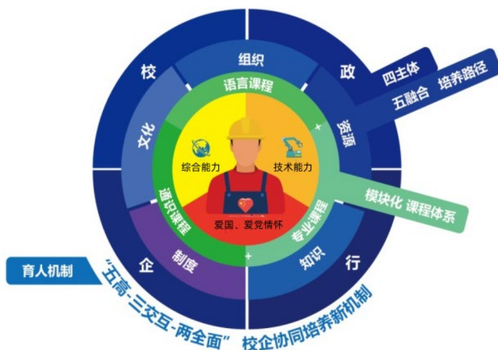
图 4 内江职院-易普力爆破项目工程师培养模式

内江职院与易普力四川爆破公司经过五年的探索，形成了以职业素养为导向，以职业关键能力为核心，综合能力和“X”技能并重，同时融入中国文化的“双线一体化”培养新模式。在探索和实践过程中，不断明晰了具有爱国、爱党情怀，掌握各项专业技术技能的人才培养新规格；校、政、行、企四方共同构建了党建引领下的组织、资源、制度、知识和文化的“五融合”育人新路径；形成了“五高一三交互一两全面”的校企协同培养高水平爆破项目工程师的新机制；无缝衔接企业走出去发展需求，校企双方共同建立了“通识课程+专业课程”的易普力爆破项目工程师项目课程体系，全面规划学生学习和职业生涯发展路径，并根据实施中的问题进行动态调整。