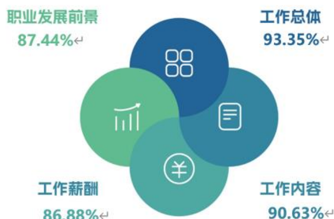
图 7 2023 届毕业生对工作满意度的评价

学院 2023 届毕业生对目前工作总的满意度为 93.35%。对工作内容、职业发展前景、薪酬的满意度分别为 90.63%、87.44%、86.88%；可见毕业生对初入职场的岗位和工作内容等方面均比较认同。