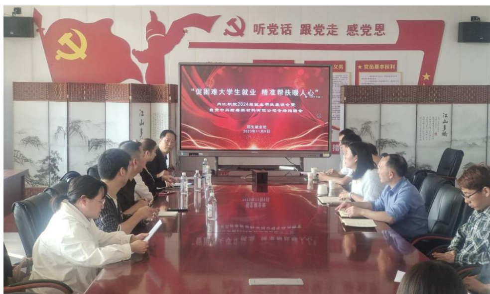
图 8 毕业生帮扶座谈会暨专场招聘会

学院为毕业生组织开展“宏志助航计划”高校毕业生就业能力培训。学院邀请内江市残联、东兴区残联、内江市就促中心、内江驻成都农民工工作站进校开展困难毕业生就业帮扶座谈会,为困难群体毕业生组织专场招聘会,为困难毕业生“送岗上门”。学院建立了一套困难群体毕业生就业帮扶工作体系,充分发挥好了桥梁纽带作用,深度挖掘适合困难群体特别是残疾毕业生的就业岗位,千方百计为同学们提供就业服务,护航困难毕业生顺利就业。