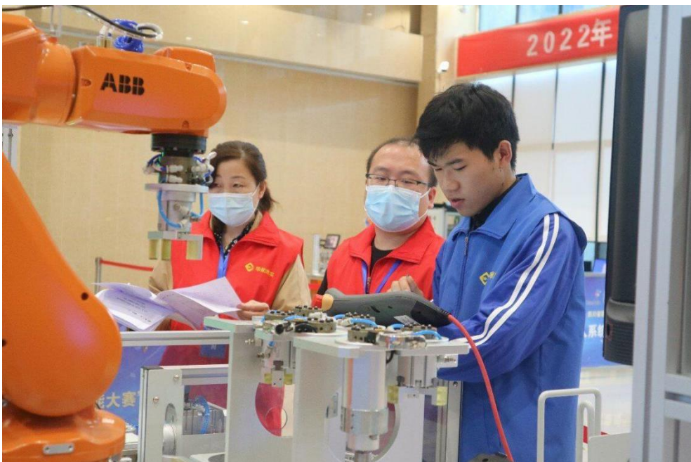
图 5 学生参加 2022 年机器人系统集成竞赛

本学年学院组织学生积极参加各级各类比赛 77 项，获得省级以上奖项 326 项，共计 875 人次。其中国家级一等奖 4 项，二等奖 8 项，三等奖 18 项。参加四川省职业院校技能竞赛 26 个赛项的竞赛，获奖 38 项，共计 90 人次，在四川省参赛的 86 所高职院校中排名第 11 位。同时，学院还积极组织学生参加省级本科高校大学生竞赛 16 个赛项的角逐，获奖 212 项，共计 472 人次，在 67 所参赛职业院校中位列第 6 位。