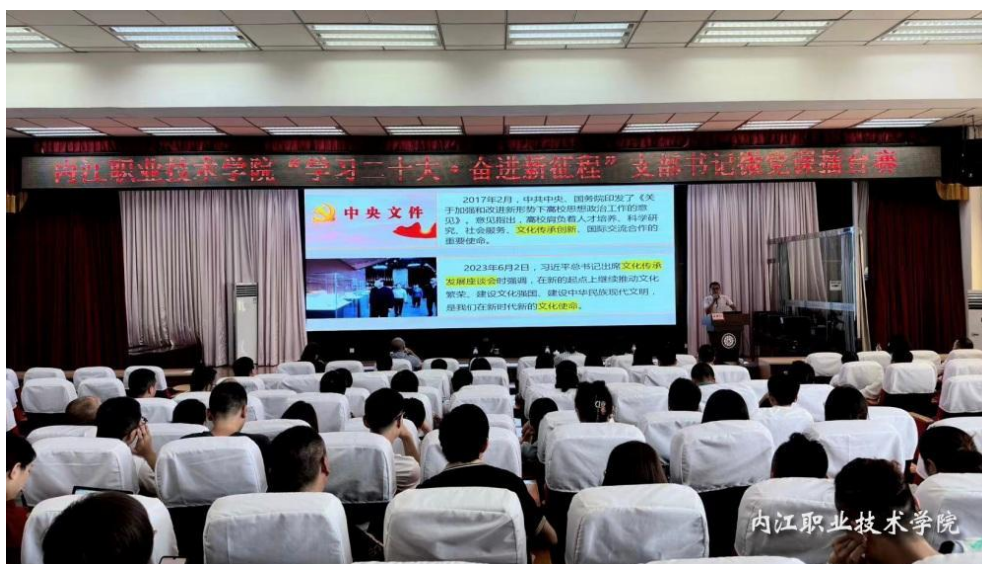
图 27 开展支部书记党课擂台

此次微党课擂台赛不仅提高了党员干部的理论水平和实践能力，也增强了支部的凝聚力和战斗力。同时，比赛还为学院选拔出了一批优秀的支部书记和党员代表，为学院的发展提供了有力的人才支撑。通过此次比赛，内江职业技术学院的党员干部更加深入地了解习近平新时代中国特色社会主义思想和党的二十大精神的核心内容和重要意义，更加坚定了永远听党话、跟党走的理想信念。同时，比赛也为学院营造了良好的学习氛围和积极向上的工作氛围，为学院的发展注入了新的动力和活力。