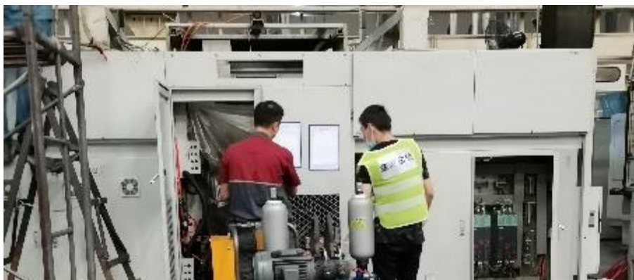
图 13 “学徒”正在跟师学习

智能制造与汽车学院的汽车制造与试验技术专业群在人才培养过程中，不断探索并实践“多元共育、工学交替、虚实结合”现代学徒制人才培养模式，得到政府及同行认可。多元共育是指将学生的学习与社会的需求有机结合，学院与企业、园区多方合作协同育人；工学交替是面向企业真实生产环境的任务驱动式实操教学，将教室设在企业，将课堂搬到车间，在课堂和生产现场交替学习，理论课教学内容与生产实际相结合；虚实结合是指运用数字孪生技术，实现生产过程仿真的“虚”与现场生产设备加工的“实”相互结合，让学生既能看到真实产线生产过程，还可以进行虚拟仿真调试。专业群开展现代学徒制人才培养达到 370 人/学期，规模占同年级比例 27%。“聚焦企业人才需求，服务产业增值赋能——内江职业技术学院学徒制模式改革的创新实践”被收录为教育部产教融合典型案例，建设经验得以广泛推广。