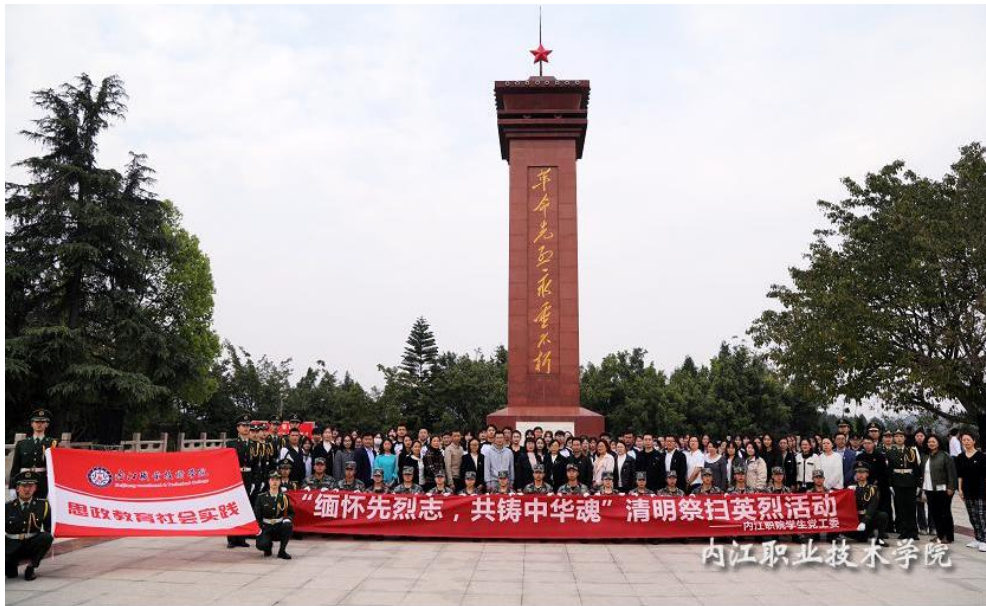
图 23 开展“缅怀先烈，共铸中华魂”思政实践活动

个体内化等形式，促使学生形成稳定的传统文化价值意志，内化于心，外化于行。将大学生道德观与日常管理、文明校园及党的二十大精神有机结合，充分发挥中华优秀传统文化育人功能，用故事育人，引导广大学生成长为有理想、敢担当、能吃苦、肯奋斗的新时代好青年。