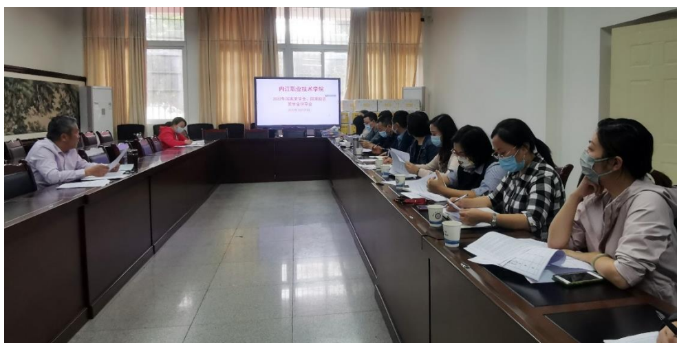
图 12 2022 年秋季学期国家奖学金、励志奖学金评审