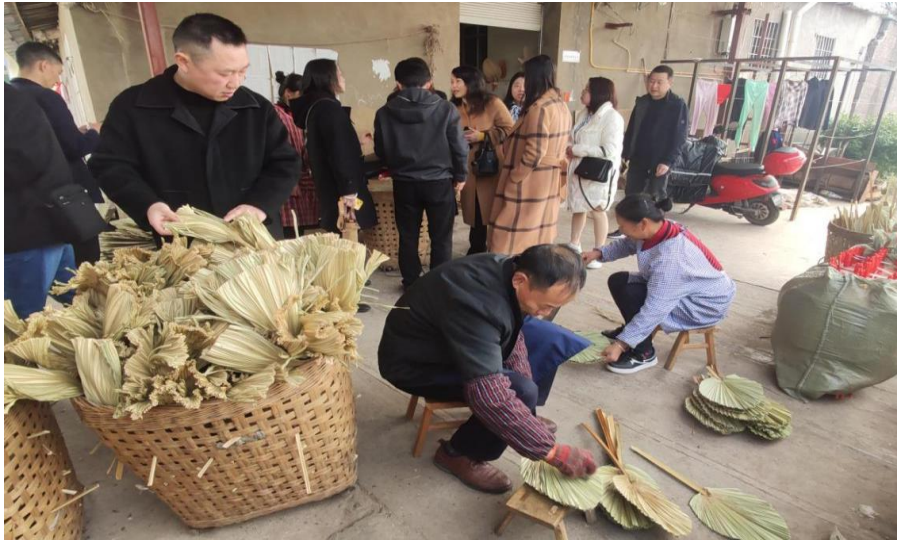
图 22 内江市蒲葵产业品牌升级调研