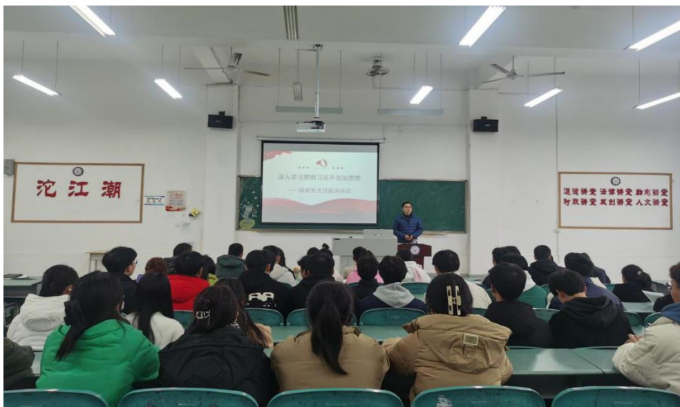
图 24 沱江潮六大讲堂活动现场