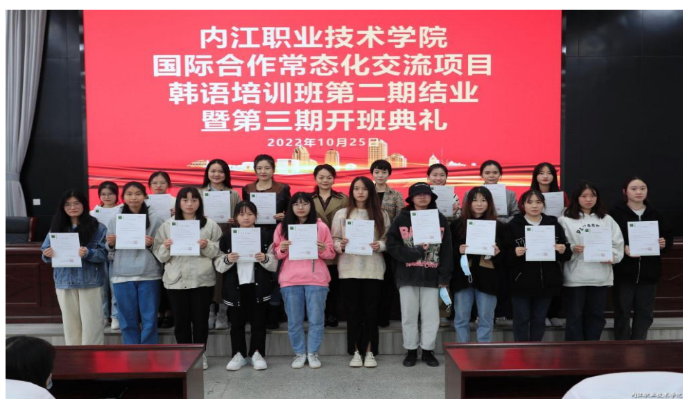
图 25 学院国际交流项目韩语培训班第三期开班

就学院输出和引进具有国际影响的职业教育标准、课程资源开展合作洽谈；参加中国-老挝职业教育发展共同体成立一周年年会；确立东盟职培中心合作院校，借助该平台推动共建国际化的职业教育培训中心。2023年7月，智汽学院教师在线开展一场工业4.0所涉及的关键技术在智能制造业应用方面的全英文讲座，东盟的大学和企业500余名学员参加了此次讲座。讲座基于学院成果导向的人才培养国际课题研究和汽车制造与试验技术省“双高”专业群建设实践，通过理论讲解与案例展示相结合，为“一带一路”沿线国家职教官员、职教组织、院校管理者、教师、企业员工提供中国职教经验和方案，助力沿线国家职教发展，促进交流互鉴。学院第一本国际教材“Automotive fault diagnosis and elimination”以及课程标准《工业机器人操作与编程》、《智能控制技术》、《自动化生产线的安装与调试》已面向东盟国家出版，被中国-东盟技术教育合作平台（CATECP）网站收录。