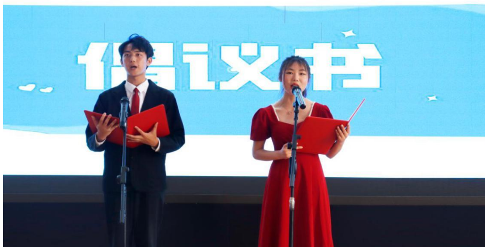
图 19 第二届校园阅读文化节暨网络文化节启动