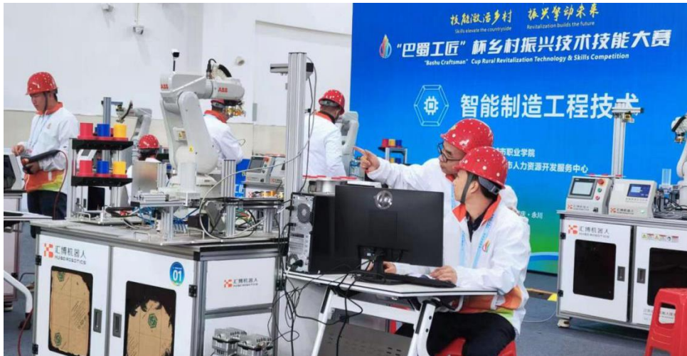
图 16 教师个人参加“巴蜀工匠”杯乡村振兴技术技能大赛